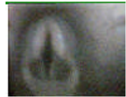
För dålig skärpa och färg.